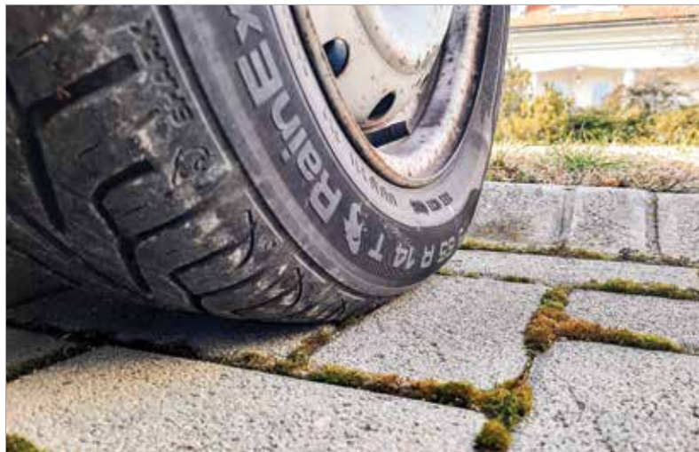
A téli gumik szezonjának vége, de csak megfelelő állapotban lévő nyáriakat tegyük fel helyettük!

ban is aranyat ér! És végül egy alapos külső mosás sem árt! Ne spóroljunk a habbal, főleg, ha hónapok óta csak a csapadék tisztította az autót!