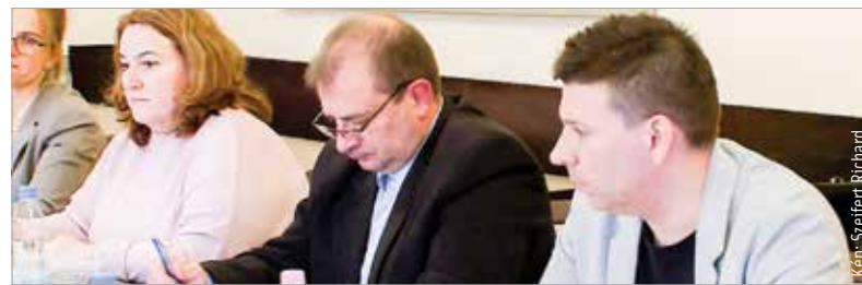
Jelöltek nyilvántartásba vételéről döntött a Helyi Választási Bizottság

A Helyi Választási Bizottság két független jelölt mellett a Mi Hazánk, a Fehérvárért Közös Egyesület, a VÁLASZ és a Fidesz jelöltjeit vette nyilvántartásba. A határozatok három nap elteltével emelkednek jogerőre.