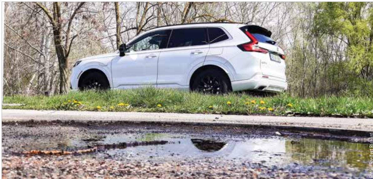
Tavaszi körülményekhez tavaszi felkészítés dukál, hogy ideális társ maradjon az autónk!

Nem kényeztette el a tél az évszak rajongóit, de azért időnként hótakaró is fedte a tájat és az utakat. Szóval szükség volt a megfelelő abroncsokra, melyek viszont most, hogy a hőmérséklet kis kitéréssel felfelé kúszik, ideje, hogy pihenőre menjenek. Ha már fent vannak a nyári gumik, érdemes ellenőrizni a motorolajszintet, de a hűtőfolyadékra sem árt ránézni! Ha pedig már nyitva a gépházfedél, a motortérben pihenő falevelektől és egyéb, nem odaillő maradványoktól is jobb megszabadulni, mert ezek idővel eltömíthetik a vízelvezető csatornákat, és tönkre is tehetik a fémfelületet. Remélhetőleg a téli ablakmosó is elfogyott a tartályból, melyet mostantól nyárral kell pótolni! Az elmúlt hónapokban többször is befagyott szélvédő fogadta a szabadban parkoló autók tulajdonosait, így az ablaktörlő lapátokra is több munka várt. Ezeket is ellenőrizzük, és ha gyengén teljesítenek, vegyünk újat, és pattintsuk a helyére! Ferde hátú autókön a hátsókat is vizsgáljuk meg, és ha szükséges, cseréljük! A hideg az akkumulátorokat sem kíméli. Ha gyengén muzsikálnak indításkor, egy töltéssel érdemes