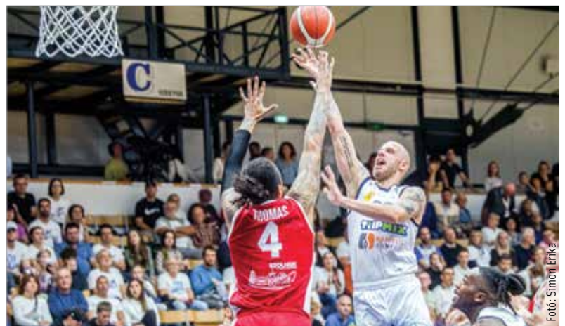
Az alapszakaszban kétszer is legyőzte a Fehérvár a Szolnokot, de az elődöntő így is nehéznek ígérkezik

A két klub közös történelme tele van nagy rájátszás csatákkal, köztük nem egy döntővel. Bár utoljára nyolc éve találkoztak ebben a szakaszban, az már a tizedik Alba-Olaj párharc volt 1998 óta. A mérleg teljesen kiegyenlített: ötször az egyik, ötször a másik fél nyert, és még a bajnoki elődöntőket tekintve is 1-1 az állás. Vagyis „történelmileg” megjósolhatatlan a párharc kimenetele, de az nem mellékes, hogy a pályaelőny mindig sokat számítot! Az pedig jelenleg a Fehérvárnál van, mely szombaton hazai pályán fogadhatja régi ellenfelét az elődöntő első meccsén!