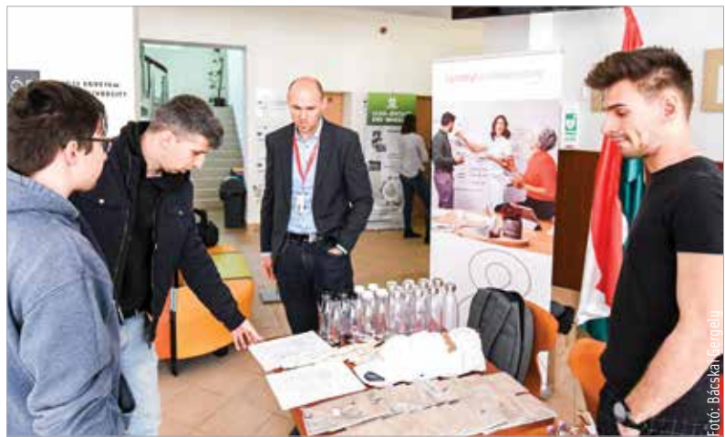
Az intézmény duális vállalati partnerei közül számos cég mutatta be gyakorlati képzési kínálatát a leendő egyetemistáknak