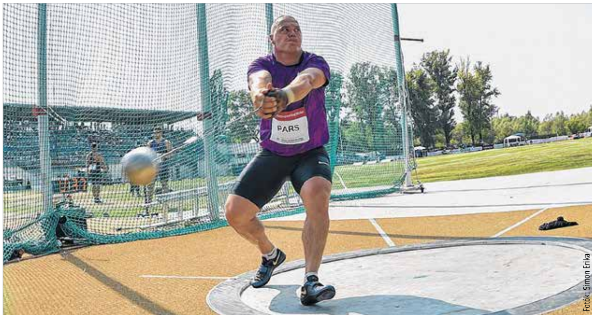
Pars Krisztiánnak ezúttal meg kellett elégednie a második hellyel, de a pekingi világbajnokságon visszavághat nagy riválisának, a Gyulai István Memorialt megnyerő lengyel Fajdeknek

Női százon is erős mezőny gyűlt össze. Az egykori világbajnok, a jamaicai Veronica Campbell-Brown nagyot futott, egy századdal tizenegy másodperc alá került, idei legjobbját érte el ezzel. Kényelmesen győzött, az amerikai Tianna Bartoletttal majdnem két tizeddel verte. A 10,99-es idő egyben új versenycsúcsot is jelent.