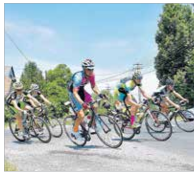
A rekkenő hőség ellenére remek iramban tekert a mezőny

Nagy csatát hozott a hatvan év feletti korosztály versenye is. Meglepe-