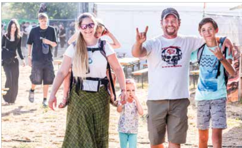
Indulhat a lazulás – akár családosan is!