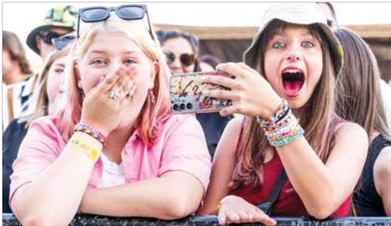
Partihangulat, jó társaság – több tízezer vendéget várnak a négy nap alatt