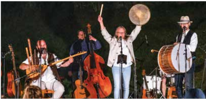
A Misztrál minden évben nagy sikert arat