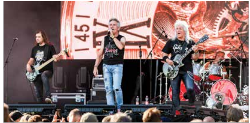
Az első fellépők egyike a Lord volt