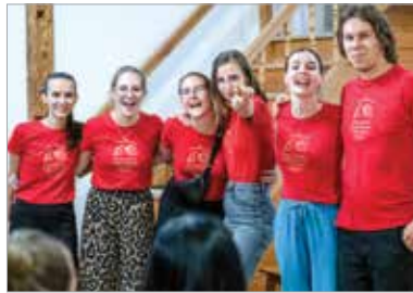
Táborcsinálók: a Fehérvári Versünnep egykori résztvevői segítenek a verstábor mindennapjaiban

Idén tizenkettedik alkalommal találkoztak a székelyföldi Csíksomortánban a Varga Sándor Verstábor fiataljai. Az idei találkozó jelmondata: „Alattad a föld, fölötted az ég, benned a létra.” A fehérvári önkormányzat a kezdetek óta támogatja a programot, ahol az irodalom és a kultúra iránt érdeklődő fehérvári és határon túli fiatalok, köztük a Fehérvári Versünnep döntősei merülnek el a versek birodalmában.