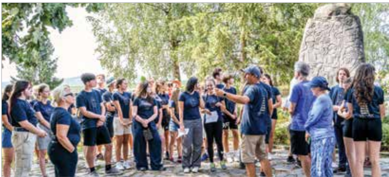
Idén is megemlékeztek a táborozók Tamási Áronról