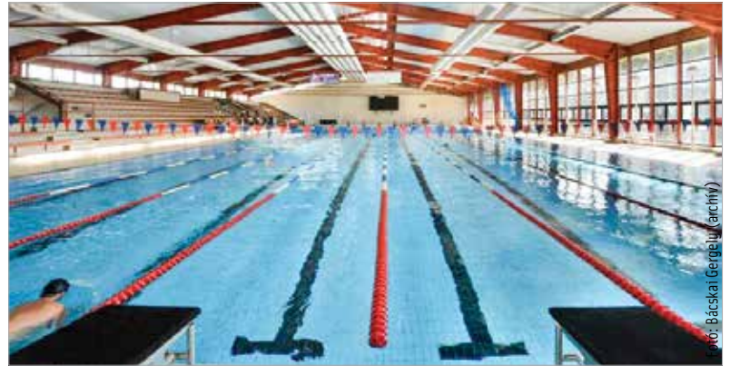
Az intézmény várhatóan szeptember elsején nyit ki újra

Emellett a hajszárítórendszer is megújul az uszodában, így aztán szeptembertől minden készen áll a sportolni vágyók ismételt fogadására. Addig is a nyári leállás alatt a bérlettel rendelkezők hétköznapon reggel 6 és 8 óra között a strand ötvenméteres medencéjében két pályán úszhatnak.