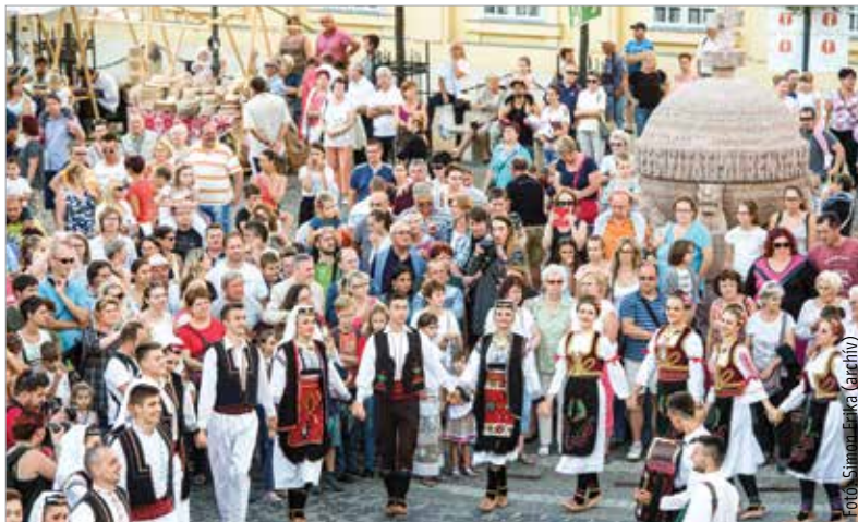
A korábbi hagyományokhoz híven ezúttal is lesz felvonulás és utcatánc. Idén mexikói, spanyol és szlovák táncosok ismertetik meg népük kultúráját.

A Királyi Napok Nemzetközi Néptáncfesztivál résztvevői augusztus tizenötödikén, csütörtökön 19 órakor a Zichy színpadon ünnepélyes zárógálával, este fél tízkor a Táncházban a Coco Loco zenekar latin táncstíjével és Paraba Világzenei Klubbal búcsúznak.