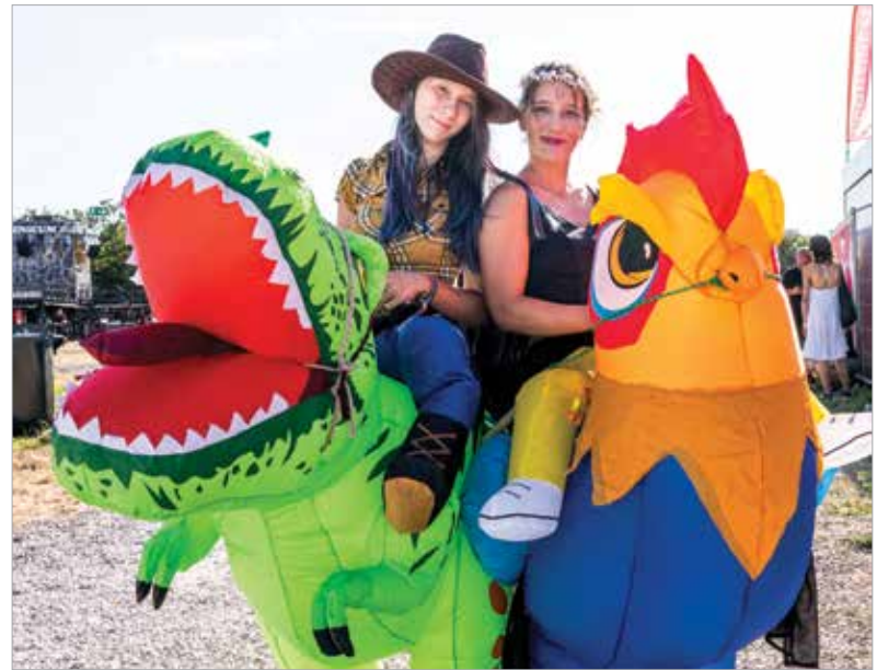
Itt mindenki megtalálja a maga stílusát