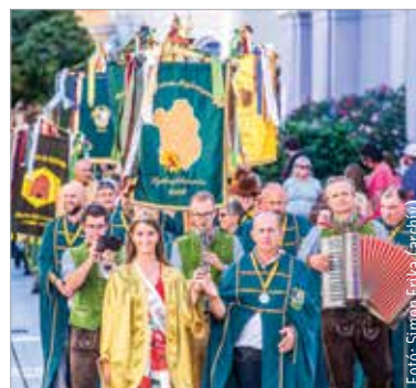
Ahogy tavaly, idén is eljönnek a rendezvényre a Kárpát-medencei mézlovagok. Felvonulásuk augusztus tizenegyedikén, vasárnap lesz a Liszt Ferenc utca – Fő utca – Országzászló tér útvonalon.

A méhészek célja, hogy megismerjék és népszerűsítsék a magyar mézet, a rendszeres mézfogyasztást és a különböző méhészeti termékeket. A szervező Szent István Mézlovagrenden túl jönnek résztvevők a Kárpát-medence minden részéről.