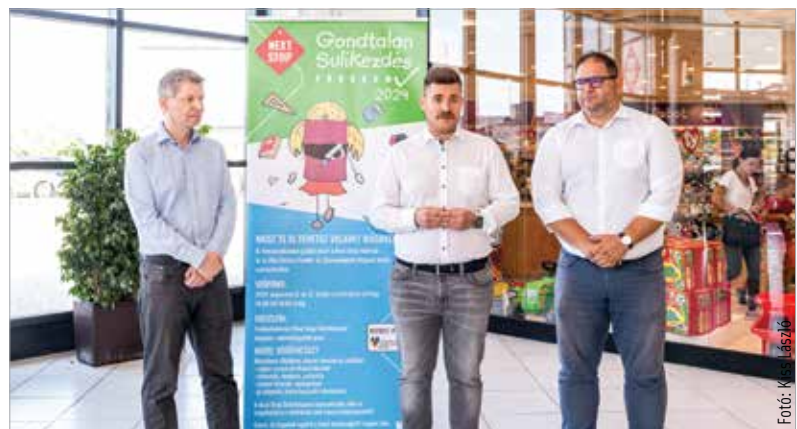
Az adományokat a Next Stop Üzletközpontba várják délelőtt tíz és este hat között