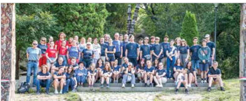
Együtt a csapat

programokkal várták a fiatalokat: „Minden évben más a tematikánk, ezt a szakmai csapat választja ki. Azon személyek köre, akik nyári szabadidejüket nekünk adják erre a tíz napra, állandó.