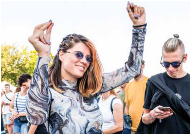
Szerda délután lendültek először a kezek a magasba

Carson Coma nyitotta meg az idei fehérvári zenei fesztivált, ahol újra két szabadtéri nagyszínpad előtt tombolhatunk, de sátras színpad és több partihelyszín is várja a bulizókat. Szombatiig fellép egyebek mellett Desh, a Valmar, a Halott Pénz, az ATB, a Moby Dick, a Crownshift, a Depresszió, a Sodom, Korda György és Balázs Klári, Majka, a Scooter, a KK's Priest és a Fish!