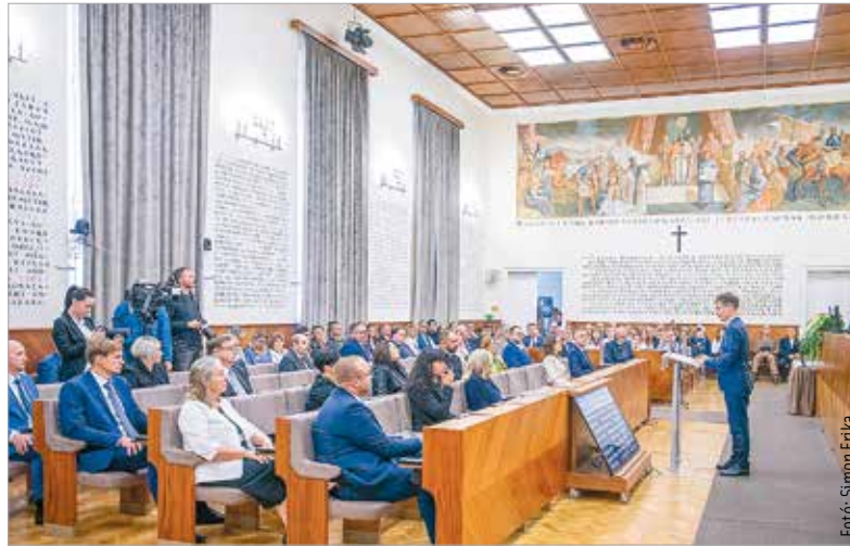
Október negyedikén megalakult a város új közgyűlése

„Ünnepi és alázatra intő pillanatok ezek, egy ezeréves város bízta ránk