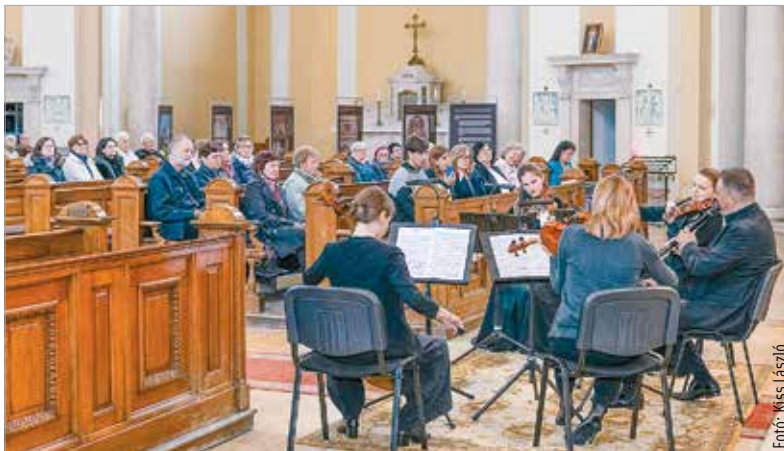
A Szimfonikusok Mozarttal emlékeztek