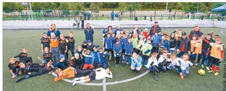
A Felsővárosi, a Hétvezér, a Zentai, a Kossuth, a Széna téri és a Vasvári negyedik osztályos tanulóinak csapatai küzdöttek meg egymással a Túrósáki úti focikupán