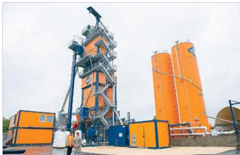
A gép óránként kétszázötven tonnányi aszfalt előállítására képes

A vállalat dolgozott a 62-es elkerülő kiépítésén és a nyugati elkerülő út kialakításán, de a Berényi út felújítása is nekik köszönhető.