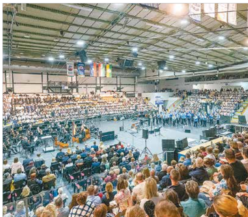
Ezúttal is telt ház volt az Alba Regia Sportcsarnokban