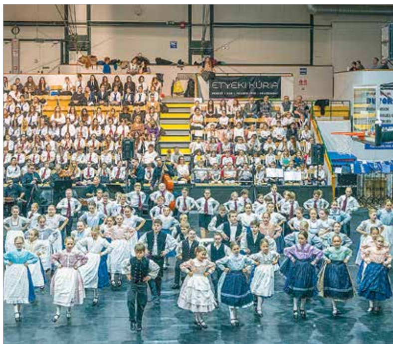
Az ünnep része volt a néptánc is