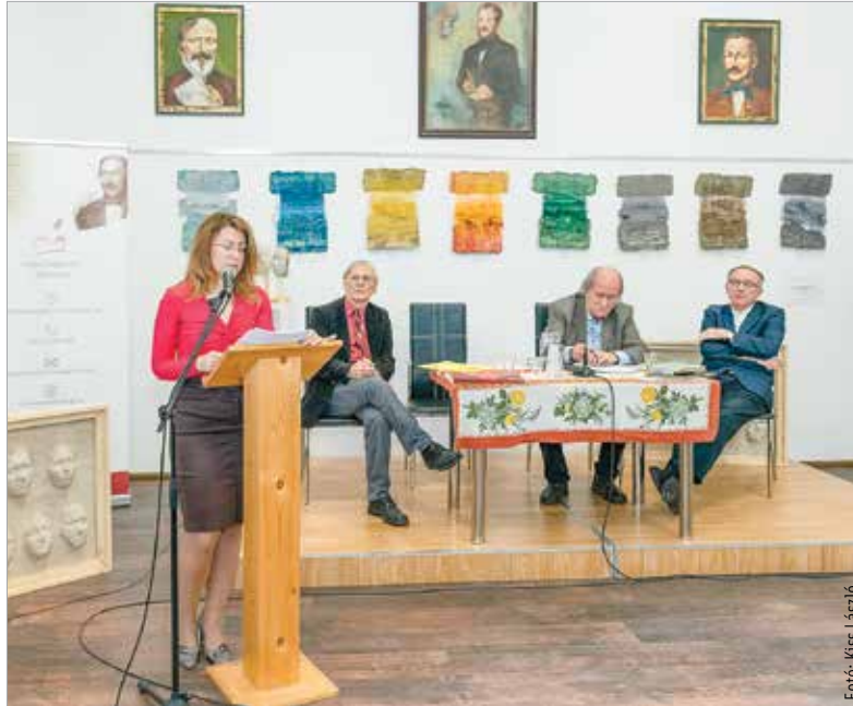
A kétnapos rendezvényen a résztvevők teljesítették küldetésüket, a magyar nyelv egyetemességének szolgálatát