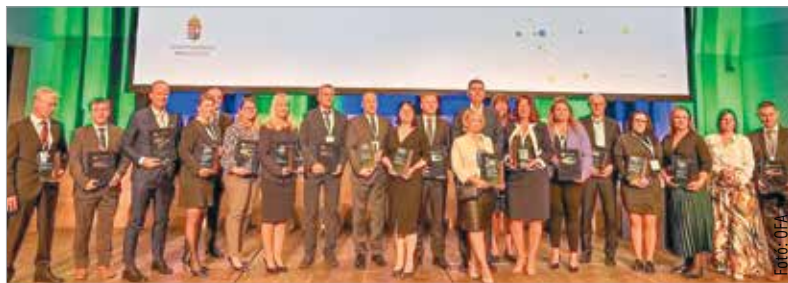
A város önkormányzata is köszöntötte a díjazottakat: a fehérvári közösség nevében is gratulált mindhárom díjazottnak, megköszönve a kollégáikért végzett erőfeszítéseket, a felelős foglalkoztatói hozzáállást