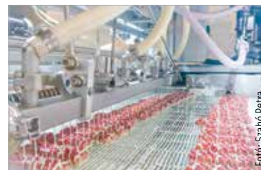
Hamarosan elkészülnek a deszszerstszerteletek

A közel kétszázféle terméket gyártó székesfehérvári cég több mint négy évtizedes tapasztalattal rendelkezik a magyar élelmiszeriparban, és büszkén ötvözi a hagyományt a modern technológiával. Az üzemben százötven munkavállaló dolgozik. A fejlesztéssel immár négy gyártósora van a cégnek, miközben a beruházás által a vállalat müzliszerstszerteletgyártási