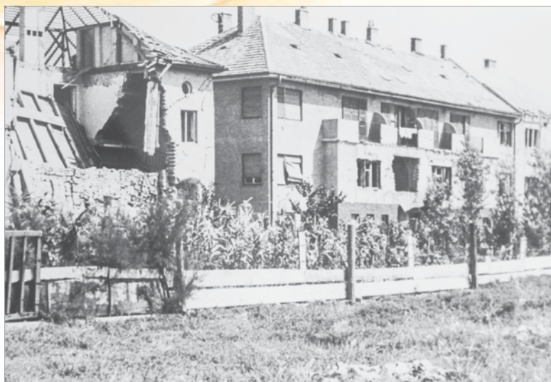
A Móricz Zsigmond utca 1945-ben

A második világháború okozta pusztítást követően az épületek újjáépítését többnyire maga a lakosság végezte. A közületi ingatlanok száma az államosítás és a lakásépítések következtében megnövekedett. Az állami lakások kezelésével hivatásszerűen foglalkozó első szerv Fehérvár területén a Kerületi Ingatlan Központ Székesfehérvári Kirendeltsége volt, mely 1949. április 15-én alakult budapesti székhellyel.