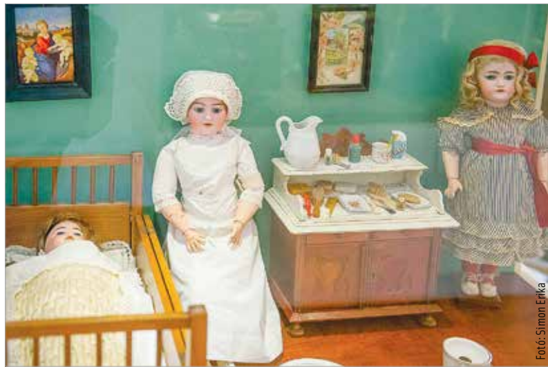
A gyűjtemény minden darabjának története van. Sok játékról az is tudni lehet, hogy ki készítette, ki volt az eredeti tulajdonosa, és hogyan alakult a sorsa, amíg a gyűjteménybe került.