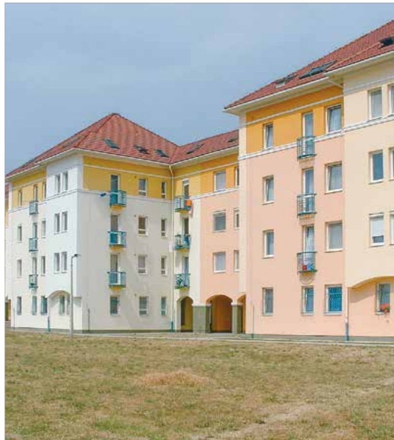
A Szépház által épített Gáncs Pál utcai lakótelep

2004-ben az egykori IKV építőipari szegmense a Szépház Építő Kft.-be került kiszervezésre, melynek fő profilja a társasházak kivitelezése volt. Az új cég az építőipar zsugorodásának következtében 2012 decemberében beolvadt a SZÉPHÓ Zrt.-be. Ezzel megszűnt a vállalat építőipari tevékenysége, és innentől a szakemberek feladata elsősorban a saját tulajdonban lévő ingatlanok felújítása, karbantartása, állagmegóvása volt.