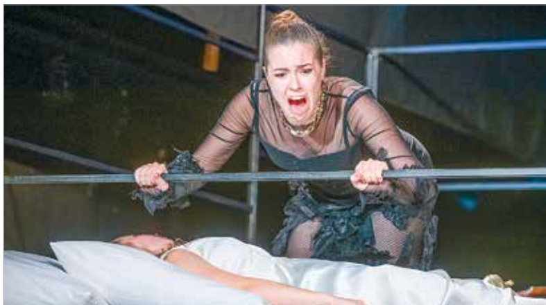
Júlia tragédiája mindenre árnyékot vet