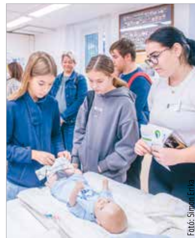
Népszerű volt a fiatalok körében a kórház standja, ahol interaktív programokkal várták az érdeklődőket