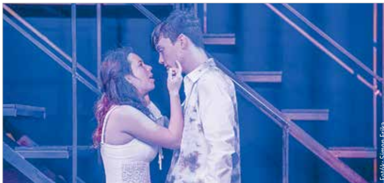
Rómeó és Júlia története örök tanulságokkal szolgál