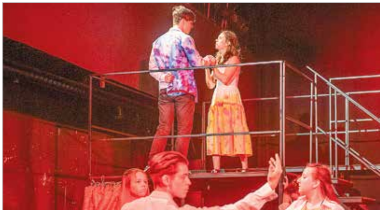
A találkozás megerősít