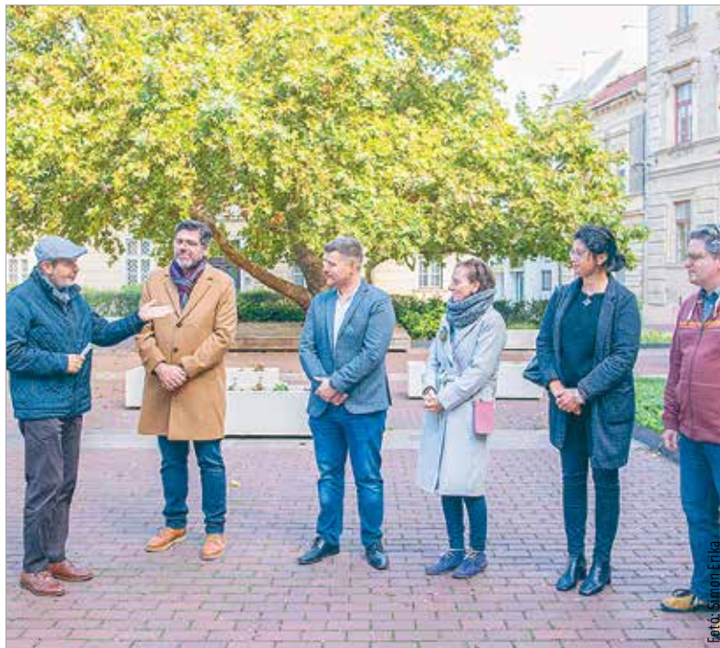
A jövő nyárig tartó időszakban öt város, Gyulafehérvár, Kranj, Opole, Zadar és Székesfehérvár valósít meg közös programokat. Az első állomás novemberben Gyulafehérvár lesz.

Jövő nyáron a projekt záróeseményének középpontjába Székesfehérvár kerül: az előadóművészeti fesztiválon az európai kulturális örökség sokszínűségét mutatják majd be.