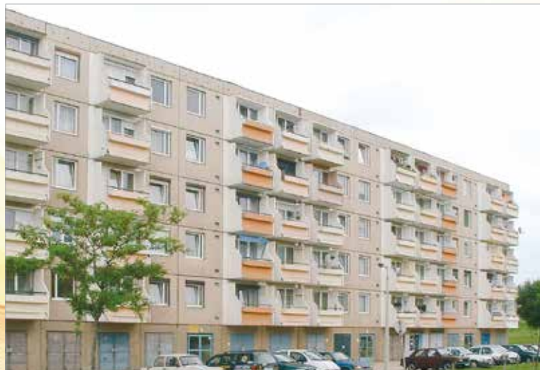
A Kelemen Béla utca 2002-ben

A kilencvenes évek elején elkezdődött a magánosítás időszaka, vagyis az önkormányzat a műemlék jellegű ingatlanok kivételével felajánlotta a bérlakásokat megvételre, melynek lebonyolításában az IKV aktívan