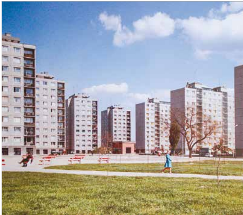
A Velinszky-lakótelep a hetvenes évek közepén

A sok állami bérlakáshoz – különösen a liftes házaknál – házfelügyelőre volt szükség. Az általuk használt lakásokkal az IKV gazdálkodott, megoldva ezzel az alkalmazott szakemberek lakáshelyzetét. A vállalat fő feladatai a liftek felügyelete és karbantartása, a fűtés biztosítása, illetve idővel a konyhabútorok és a padlóburkolatok cseréje, valamint a különböző felújítási, állagmegóvási munkák voltak.