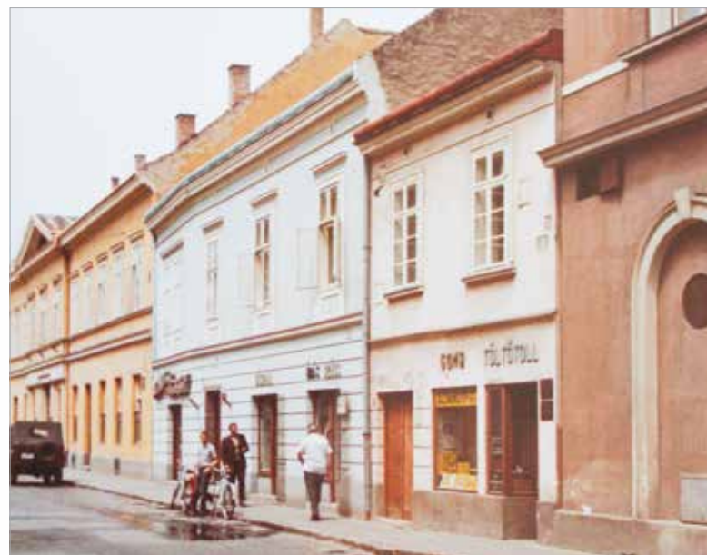
Az Ady Endre utca a hetvenes években

Budapesti mintára úgynevezett tömbtatarozások is zajlottak, melyek lényege az épületek egybenyitása, a belső terek újragondolása volt. Ez a fajta átalakítás több belvárosi ingatlant is érintett. Időnként számítani lehetett a Műemléki Felügyelőség és a Fejér Megyei Tatarozó Vállalat – a későbbi FETÉV – munkájára, de a kivitelezést zömében az IKV végezte. A tervgazdálkodásból kifolyólag csak a kapott keretből lehetett forrást biztosítani a munkálatokra, így az ingatlankezelés nem tudott minden elvárásnak eleget tenni. A kivitelezés az éves terveket felülről címjegyzék tanácsi oldalról történő jóváhagyása után kezdődhetett a legkritikusabb állapotú házak rendbetételével. A házkezelésből befolyt pénzeszségek nem fedezték az üzemeltetési és fenntartási szükségleteket, ezért a kormány a lakóházfenntartási tevékenység fedezetére