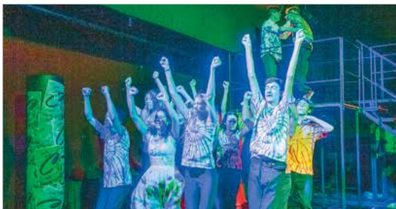
Amikor még kerek volt a világ