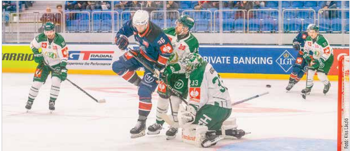
Nagyon erős ellenfelekkel szemben edződhetnek Erdély Csanádék

A CHL, vagyis az európai Bajnokok Ligája hat csoportmeccsén pont nélkül maradt a Volán, de csak a legelső, pardubicei találkozón ütötték ki. Az a 7-0-s vereség megmutatta, mennyivel jobban kell figyelni már az első percektől kezdve