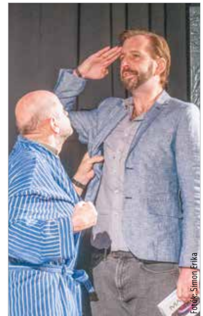
Elismerés fogadta a Péntek 3 Tejátum előadását is