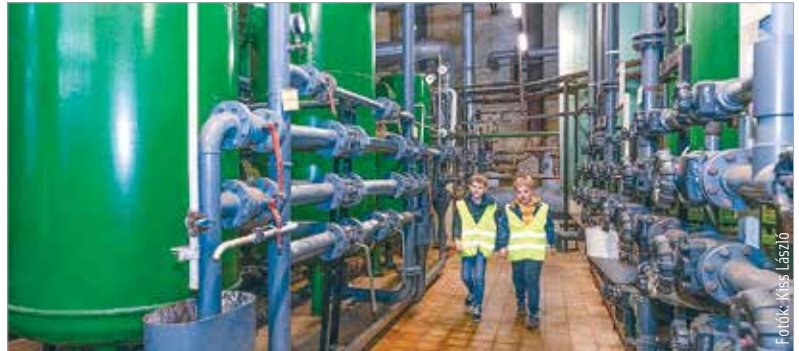
Az Erőművek éjszakája országsszerte több mint hatvan létesítményre terjedt ki, köztük erőművekre, szennyvíztisztítókra, vízművekre, víztornyokra és hulladékhasznosítókra

séggel egészítenek ki. Az évtizedek során a telephely funkciója fokozatosan átalakult. A villamosenergia-termelésről a hangsúly a hőtermelésre helyeződött át. A helyszín jelentős ipari örökséget képvisel, bemutatva a több mint egy évszázados energetikai múltat és az iparág fejlődésének fontos szakaszait. Ma már nem ez a fő hőtermelő telephely, de a téli időszakban és tartaléküzemként ez a helyszín is szükség szerint