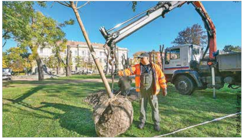
A mostani ültetéssel folytatódik a Zichy liget faállományának frissítése

Az augusztus tizennyolcadikai vihar a Zichy ligetben is komoly pusztítást végzett. A fák statikai állapota meggyengült, számos példány balesetveszélyessé vált. A menthetetlen fákat hétfőn vágják ki a Városgondnokság szakemberei,