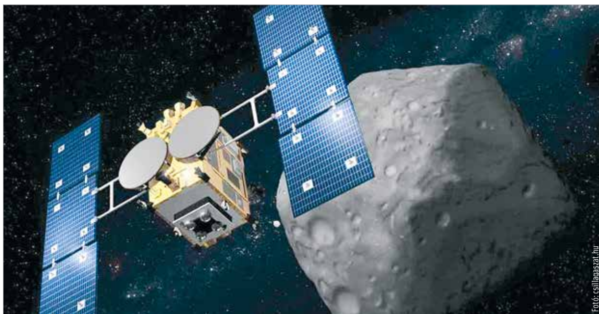
Űrszonda és kisbolygó egy művészi elképzelés szerint

Az Európai Űrügynökség és a NASA szempontjából is fontos projekt annak kiderítése, pontosan milyenek ezek a kisbolygók, mennyi van belőlük, és hogy lehet őket eltéríteni, hogy ne okozzanak problémát. Nemrég a DART űrszondája szándékosan úgy meglötte az egyik kisbolygót, hogy annak