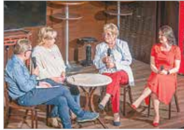
A család számára is megerősítést nyújtott az elkészült film