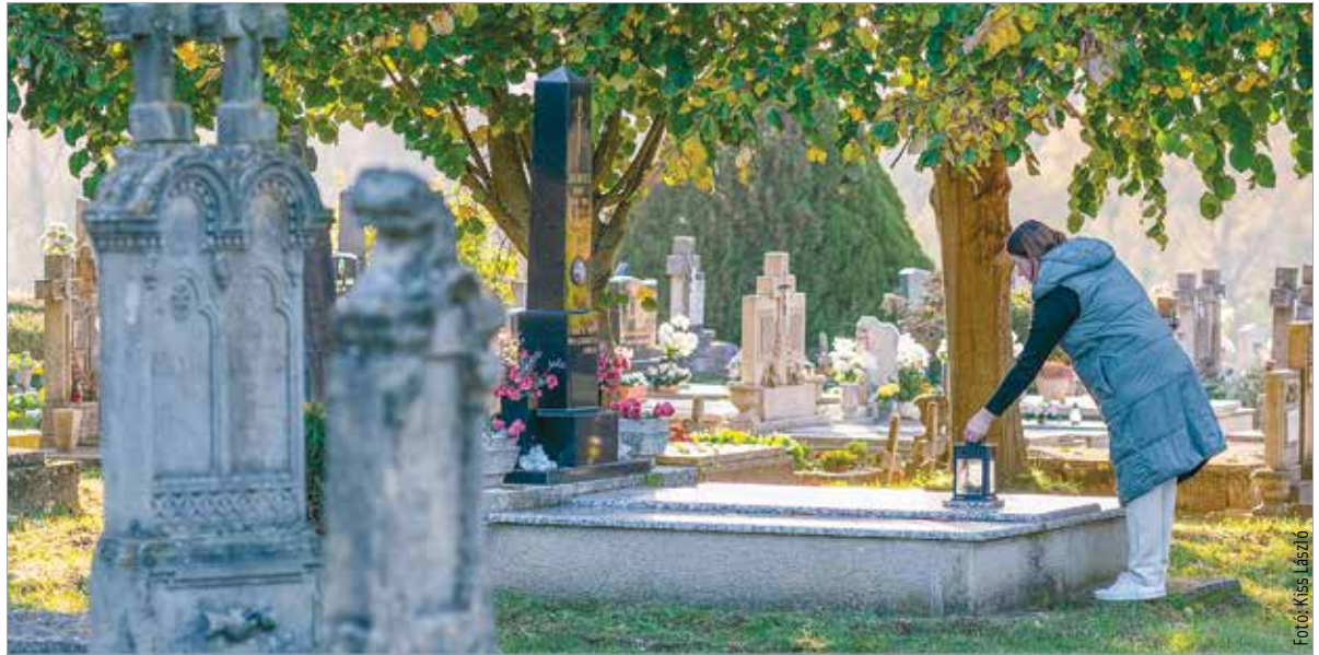
Mindenszentek és halottak napja alkalmából idén is sokan érkeznek majd a városi temetőbe, hogy szeretteikre emlékezzenek

A város ökumenikus megemlékezését Vigasztaló szó a gyászbán és emlékezésben címmel november 1-jén tartják a Béla úti köztemető díszített ravatalozóudvarában. Székesfehérvár is csatlakozott a Magyarországi Temetőfenntartók és Üzemeltetők Egyesülete által szervezett IV. Országos Minden-szentek-napi Mécsesgyűjtáshoz, így pénteken 16 órától a látogatók bevonásával, közös mécsesgyűjtással teremtenek lehetőséget az együttes emlékezésre. A Béla úti köztemetőbe október 31-én, csütörtökön, valamint november 2-án, szombaton és november 3-án, vasárnap egész nap, a temető nyitvatartási ideje alatt a látogatók – főként a mozgásukban korlátozottak – behajthatnak gépjárműveikkel. A szokásosnál jóval erősebb gyalogosforgalom miatt november 1-jén, pénteken kizárólag reggel 7 és délelőtt 11 között hajthatnak be gépjárműveikkel a mozgásukban korlátozottak, valamint azok, akik idős, beteg