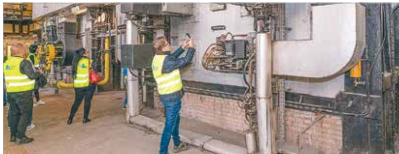
A program az országban közel hétezer érdeklődőt vonzott, Fehérváron is sokan nézték meg a Király sori telephelyet

működésbe lép, így a kazánok alkalmanként itt is bekapcsolnak. A látogatók különleges ipartörténeti túrán vettek részt, ahol egy üzemén kívüli gőzturbinát és egy hatalmas, ötezer köbméteres, kitisztított olajtartály belsejét is megtekinthették, és bepillantást nyerhettek az erőmű technológiájába és működésébe is. Az országos programot a Magyar