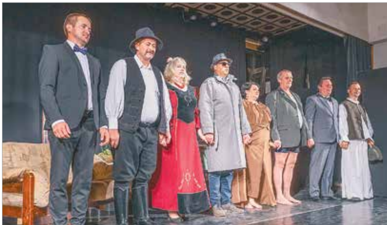
A fesztivál üde színfoltja volt a csíksomortáni Lármafa Egyesület színjátszó csoportjának vígjátéka