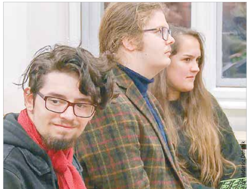
Az alkotások olyan fiatalok művei, akik a jövőben helyet kaphatnak városunk irodalmi életében

a kötet szerkesztője is örömeinek adott hangot, hogy a vers és prózaíró fiatalok szárnypróbálgatásai, az antológiában megjelent művek hiteles visszacsatolásai az együtt töltött időszaknak.