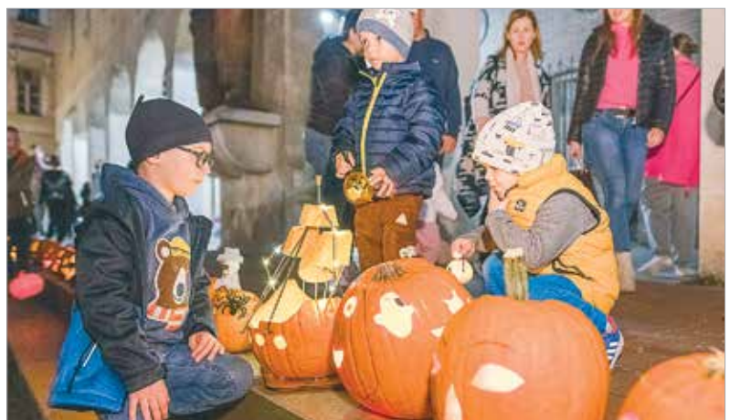
A különféle technikákkal készült alkotások között voltak klasszikus figurák, kreatív, egyenesen ijesztő arcok és állatok, sőt még egy hajó is!