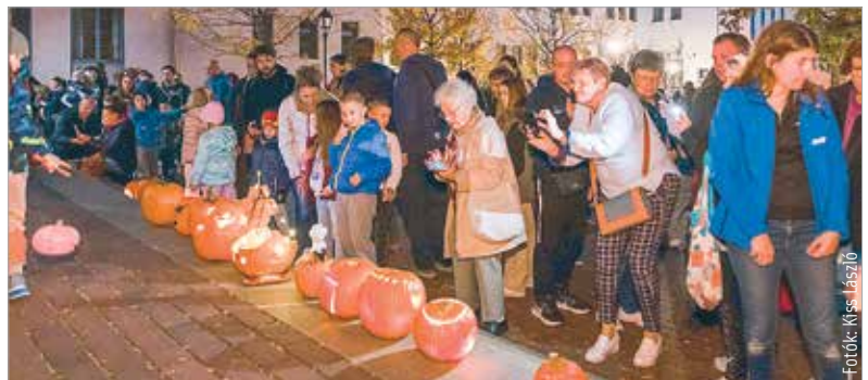
A Bartók Béla térre rengetegen érkeztek megcsodálni a családok által készített töklámpásokat

töklámpások faragása is. Mára már Magyarországon is az őszi ünnepek része lett ez a szokás, hiszen egy olyan közös program lehet, ami összehozza a családokat. A Fehérvár Média centrum pedig a várost is szeretne volna kicsit összehozni, így vasárnap immár ötödik alkalommal rendezték meg a Fehérvári Töklámpás Fesztivált.