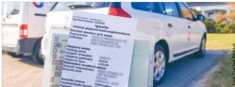
A kötelező gépjármű-felelősségbiztosítás a jármű üzemeltetése közben másoknak okozott károk megtérítését szolgálja, ezért kötelező azt időben megkötni, és rendszeres díjfizetéssel érvényben tartani a szerződést

A KGFB alapesetben határozatlan időtartamú. Abban azonban különbség van, hogy a tulajdonos 2010. január 1-je előtt vásárolta-e meg a gépjárművet vagy lett annak üzemeltetője, ebben az esetben ugyanis a kötelező szerződésének évfordulója minden év december 31. napja, új szerződés pedig január 1-jei kockázatviselési kezdettel köthető. Minden 2010. január 1. után