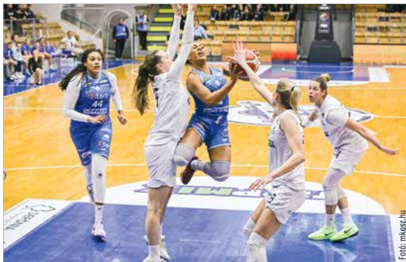
Kemény védekezéssel nehezített meg ellenfele dolgát a DKKA