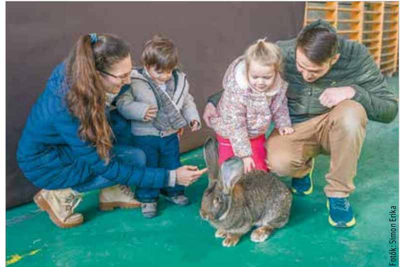
Nagy népszerűségnek örvendtek a különleges nyúlajták