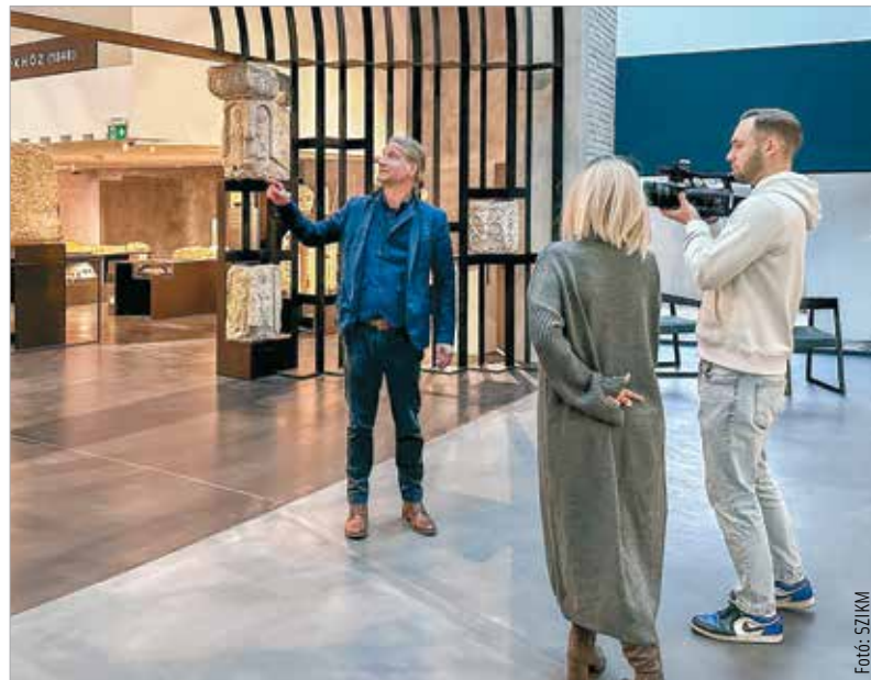
A tárlaton látható a bazilika teljes háromdimenziós modellje digitális formában, és egy „di- gitális homokasztal” segítségével a középkori városfal fel- és átépítésére is lehetőség nyílik

A látogatóközpontban nemrégiben nyílt egy időszakos kiállítás,