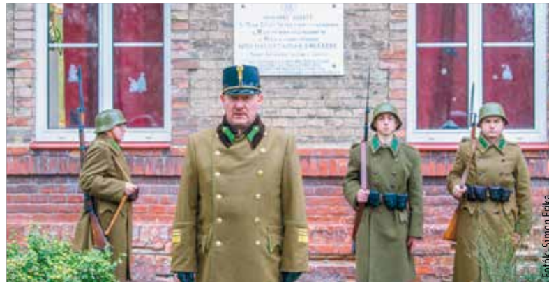
A Honvéd Hagyományőrző Egyesület és a Doni Bajtársi Szövetség szervezésében a Magyar Királyi Szent István 3. Honvéd Gyalogezred katonáira emlékeztek pénteken a Lánosz Kornél Gimnázium falán található emléktáblánál, majd emlékményt indult a vármege hét pontjára