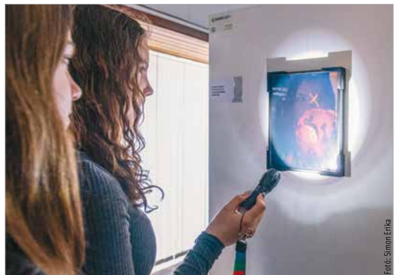
A kiállítás február végéig látogatható, elsősorban iskolai csoportok számára. Előzetes bejelentkezésre az Alba Innovár elérhetőségeinek bármelyikén lehetőség van.

A kiállítás Gábor Dénes életéről és találmányairól is olvashatnak az érdeklődők, akik nagy valószínűséggel érkeznek is majd szép számmal. Az elmúlt évben négyezer látogatóval került kapcsolatba az Alba Innovár, ha pedig az elmúlt nyolc évet nézzük, több mint negyvenezer fővel került az élményközpont kapcsolatba különböző kurzusok keretében.