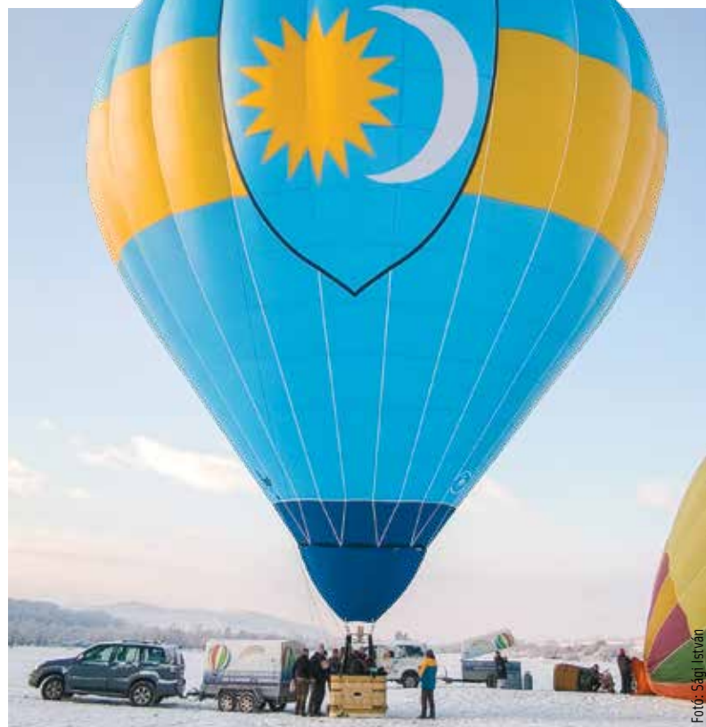
A székelly ballon szombati rajta után egy órát töltött a levegőben, majd Nyáradremete északi határában landolt. Utasai kijelentették: szépen repült, ahogyan a székelly lélek teszi azt!

Ne legyenek illúzióink az irányítással kapcsolatban, a lehetőségek korlá- tozottak. Két eszköz van, az egyik a meleget biztosító égő, a másik a bal- lonon lévő nyitható-zárható nyílások. Az égő használata növeli a ballonban lévő levegő hőmérsékletét, elzárása csökkenti azt. Előbbinél emelkedik, utóbbinál süllyed a szerkezet. E süllyedést gyorsíthatjuk a ballon tetején kialakított réssel, a dugó segédletével. A nagyobb gömbök ol- dalán szabályozható rés segítségével a szerkezet saját tengelye körül forog. Az eddigiekkel pusztán az emelkedést, illetve a süllyedést vagy a landolást manőverezhetjük. Vízszintesen csak a légmozgás segíthet a pilótának, ami a különböző magasságokban eltérő sebességű, néha irányú is, a profik ezeken a szeleken szörföznek.