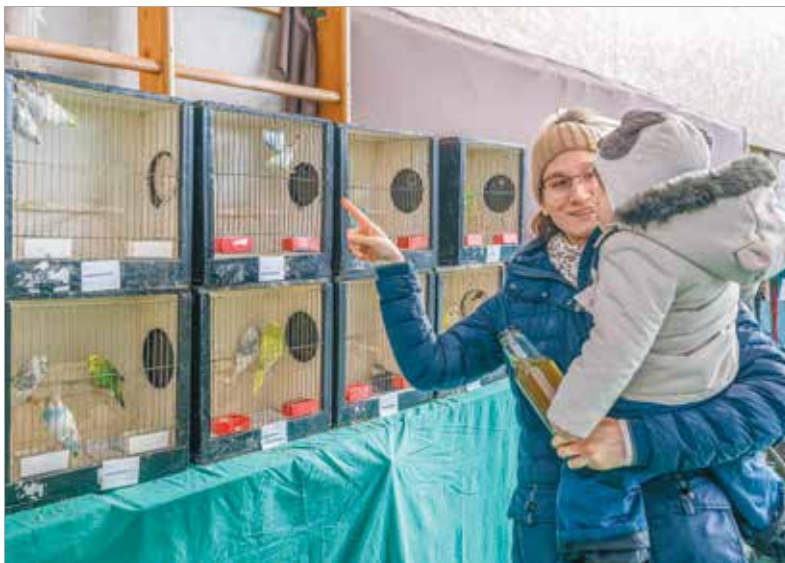
A díszmadartenyésztők is elhozták büszkeségeiket a kiállításra