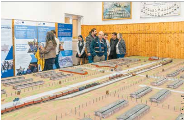
A szemléltető eszközként szolgáló makett két hétig látogatható a Széchenyiben

A holokauszt nyolcvanadik évfordulójára készült utazó kiállítás az auschwitz-birkenauai koncentrációs táborok harminckét négyzetméteres makettjét mutatja be. A cél, hogy a részletes modellek és interaktív bemutatók segítségével a megcélzott középiskolás korosztály megismerje a holokauszt történetét.