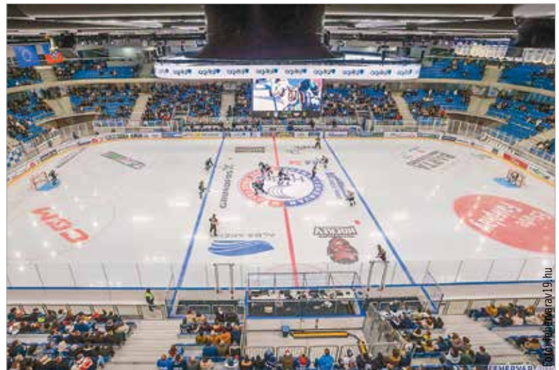
Minden meccsen impozáns látványt nyújt a fehérvári aréna