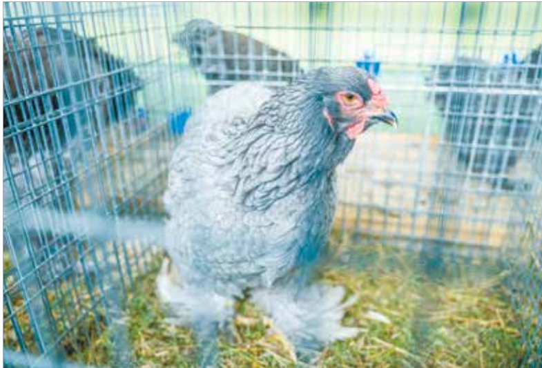
A díszbaromfik nagy sikert arattak a látogatók körében