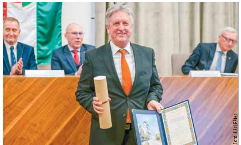
Az évfordulón megkapta a város emléklapját a Székesfehérvári Ügyvédi Kamara

Az ünnepségen Cser-Palkovics András polgármester kiemelte, hogy az ügyvédi tevékenység mindig is meghatározó volt, és ma is lényeges szerepet tölt be városunk életében.