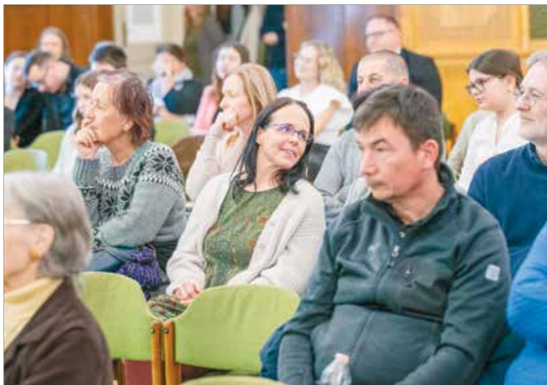
Ezúttal is megtelt érdeklődőkkel az elődöntőnek otthont adó terem

a felkészülésben a Vörösmarty Színház művészei: a mentorok sorsolására ezen a héten kerül sor.