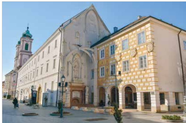
Az emlékművel felújított sarkon állt még 1872-ben Székesfehérvár utolsó megmaradt városfalrészlete egy bástyával. Helyére egy lakóház épült, 1990-re azonban elhanyagolt állapotba került. A felújítással egy időben készült el a Mátyás király és a hét szabad művészet című Melocco Miklós-kompozíció.

betöltését követően, 1453-ban kezdhetette meg. V. László idejének igen nagy részét Bécsben töltötte, ahol III. Frigyes gondos nevelgetését „élvezte”. A Szent Korona így nem került vissza Magyarországra, hiszen azt továbbra is a német „övtá”. Aztán 1457. november huszonharmadikán váratlanul meghalt a fiatal király. Sokan III. Frigyeset vádolták mérgezéssel, hiszen így neki volt a legnagyobb esélye a magyar trónra ülni, amit csak erősített a tény, hogy a Szent Korona is nála volt. Am a fent említettek miatt a nemzetgyűlés, a magyar nemesek Mátyást választották meg királyukká. Hunyadi Mátyás kétszer is megküzdött III. Frigyes csapataival, s mindkétszer vereséget mért rájuk. A harmadik, Frigyes által végsőnek hitt támadást a magyar seregek visszaverték, és Mátyás apósa, Podjebrád György, a huszita király a csehekkal összeállt seregekkel Bécsig nyomult. Így kényszerült III. Frigyes tárgyalásra Mátyással, és 1463-ban meg is állapodtak Bécs-újhelyen. Bár Mátyás többszörös győztesként kedvező pozícióban