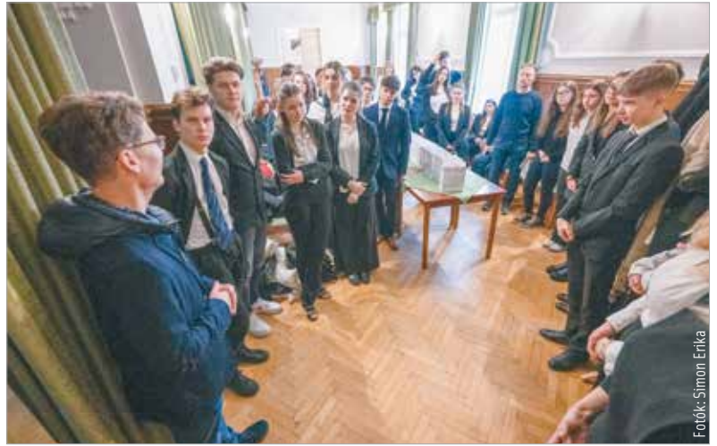
A kezdés előtti utolsó pillanatok a pihenőszobában