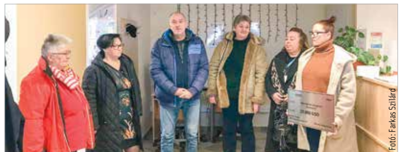
Az Arconic Alapítvány támogatása nagy segítséget jelent a rászoruló családok számára