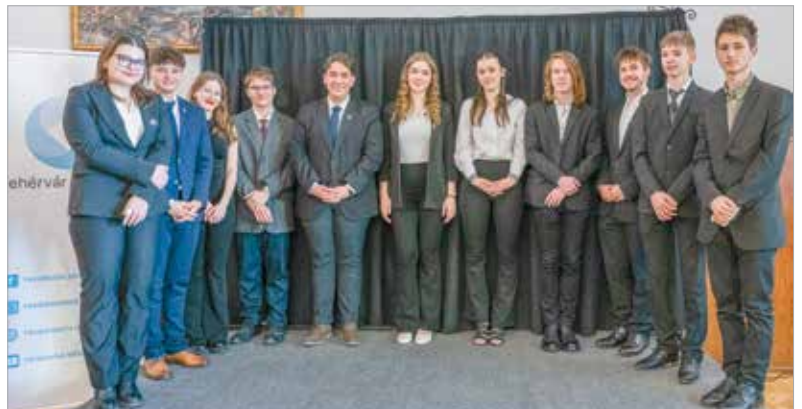
A XV. Fehérvári Versünnep elődöntőjéről készült felvétel február 23-án, vasárnap 19.35-kor lesz látható a Fehérvár Televízióban

követően mindenki egyetértett, hogy magas színvonalú produkciókkal készültek a versmondó fiatalok.