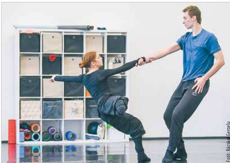
A közönség egy kifejezetten dinamikus előadásra számíthat