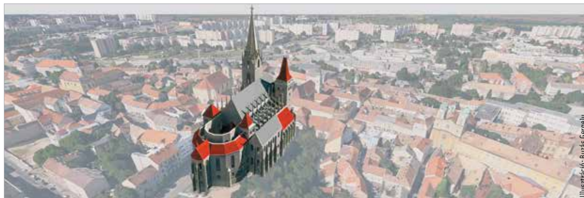
A mai városképre vetítve így nézne ki az egykori koronázótemplom, miután Mátyás király felújította. Ha a reneszánsz stílusú templom Pipó-tornyába nem rejtenék a magyar katonák lőszerkeit a török elleni csatában, majd később azt nem robbantják fel, és még később a betelepített osztrák lakosság nem hordja szét a köveket, akkor ekképp mutatna a Szent István által alapított katedrális.