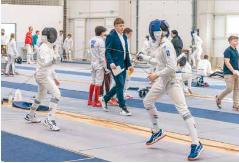
Az igazolt fiataloknak jó felkészülés volt a fehérvári esemény az előttük álló versenyekre

ám eddig állandó csarnok hiányában mindig más hol kellett azokat tető alá hozni. Ezért is jelentős előrelépés, hogy a Székesfehérvári Vívó- és Szabadidősport-egyesület a MÁV Előre SC tavaly átadott új röplabdacsarnokában, mondhatni hazai környezetben rendezhette meg a múlt hétvégén a versenyt.