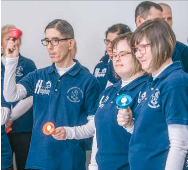
A Szent Kristóf-ház lakói műsorral készültek az ünnepélyes átadóra

A Fehérvár Travel Alapítványnak köszönhetően tizenkét mozgásában korlátozott, fogyatékossgal élő személy találat otthonra. Az alapítvány célja, hogy támogassa a rászorulókat, a hátrányos helyzetűeket, a fizikai és szellemi fogyatékkal élőket, illetve a beteg időseket és gyermekeket – elsősorban olyanokat, akik más forrásból csak minimális támogatásra számíthatnak. Közel kétszázkilencvenmillió forintból építették fel a Segesvári utcai épületet, mely a Szent Kristóf-ház második lakóotthona. 2019-ben vásárolták meg az ingatlant, az Udvarhelyi utcai ház ugyanis betelt. Ebben a házban mozgássérült, enyhe és közép súlyos értelmi fogyatékossgal élő, illetve halmozottan sérült fiataloknak biztosítanak állandó életvitelszerű ellátást.