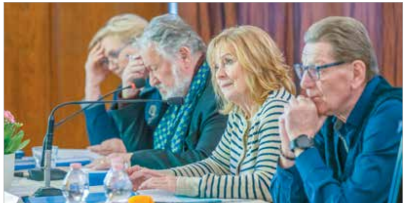
Komoly fejtörést okozott a zsűritagok számára a továbbjutók kiválasztása

Klasszikusok és kortárs szerzők versei egyaránt szerepeltek a repertoárban. Abban az elődöntőt