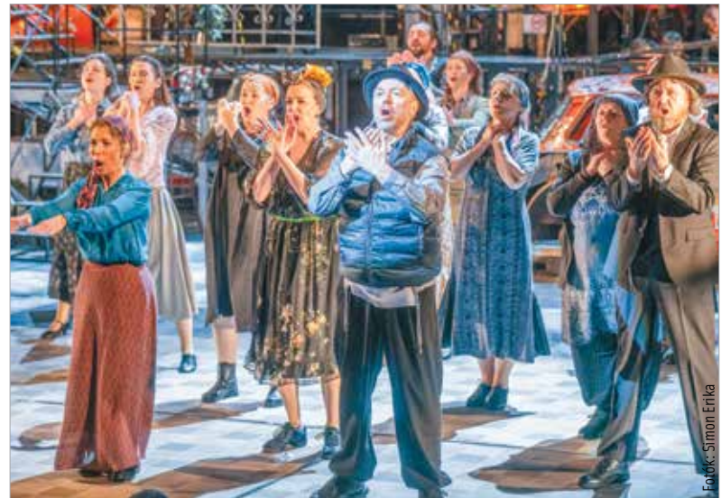
A darabban minden pillanat az összetartozás felelősségét mutatja meg

A fiatalok szerelemből kívánnak házasodni: legidősebb lányuk, Cejtel egy szegény szabóhoz, Mótélhez vonzódik, húga, Hódel Szibériába utazik fogvatartott kedvese, Perchik után, Háva, a harmadik lány pedig egy más vallású fiú mellett talál rá a boldogságra, ami komoly dilemmát