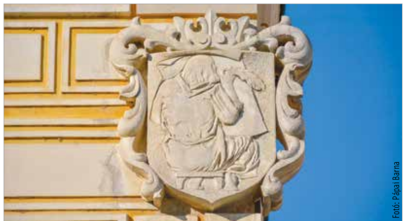
A hét szabad művészet (grammatika, retorika, dialektika, asztronómia, aritmetika, geometria és zene) egyikét, a grammatikát, azaz nyelvtant képviseli a kódexmásoló szerzetes címere

A Mátyás-émlékmű eredeti helyéül a püspöki palota keleti homlokzatát képzelte el a művész, de Szakos Gyula megyés püspök arra kérte Balsay István polgármestert, hogy ne oda tegyék, mert az Szent István-i szakraális hely – utalva a szent király sírhelyére. Belátva a püspök igazát, új helyet kerestek a városban, amit a Fő utca és az Ady Endre utca sarkánál találtak meg. Az emlékmű ott készült el. Ez a hely az egyetlen szabadtéri reneszánsz látnivaló Székesfehérváron, aminek elemeiről az fmc.hu oldalon olvashatnak fényképes illusztrációk segítségével.