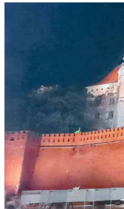
Íme, a krakkói királyi palota, a Wawel, melynek é lengyel sem akad, aki gazdasági épületnek nézné

A hasonló centrális templomok abban az időben főleg a fejedelmi, illetve uralkodói palotákhoz