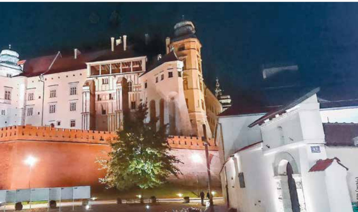
Építési jellege és elhelyezkedése a városban hasonlatos az egykori székesfehérvári nagyfejedelmi vagy királyi palotához, ám valószínűleg egyetlen

Azt tudomásul kell vennünk, hogy a megismerés lehetőségei korlátozottak. Például Géza nagyfejedelmek sírjával kapcsolatban – de egyéb uralkodói temetkezések esetében is – csak akkor állíthatunk biztosat, ha megtalálunk egy sírt, benne az elhunyt maradványaival, és mellette mondjuk egy táblát, amelyre az van írva, hogy itt nyugszik Géza nagyfejedelmek. De erre kevés az esély. A rendelkezésre álló történeti és régészeti adatok összességét – a nagyfejedelmi katonai kísérethez köthető temetkezéseket, a négykaréjos Szent Péter-templomot, Jan Długosz írását – figyelembe véve azonban igen nagy valószínűséggel mondhatjuk ki azt, hogy Géza nagyfejedelmek uralmának egyik legfontosabb központjában, Fehérvárott temették el. Abban a Fehérvárban, amely Szent István király itteni királlyá választását követően a Magyar Királyság koronázó fővárosa lett és maradt az Árpád-kor időszakában.