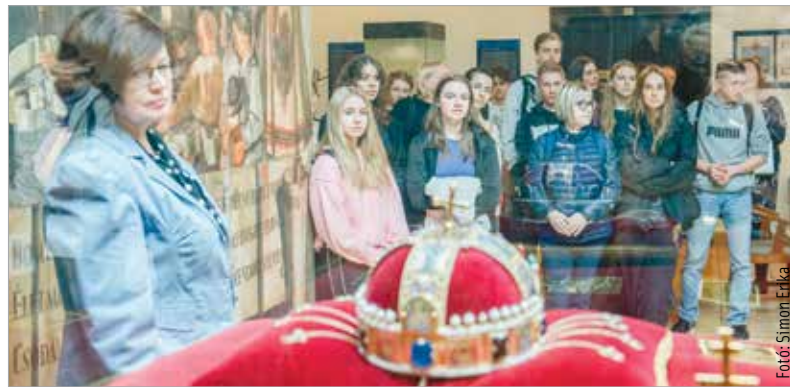
A Parler-Gymnasium lassan harminc éve partnerintézménye a Tópartinak

A Fehérvárra látogató német gimnazistáknak számos programmal készült az iskola: a városházi látogatás előtt a felújított intézményt tekinthették meg. A német tanulók a továbbiakban Budapestre látogattak, az Alba Innovárba is kaptak meghívást, majd tanórákon vesznek részt, illetve a Tóparti március tizenötödikei programjait is megtetikintik.