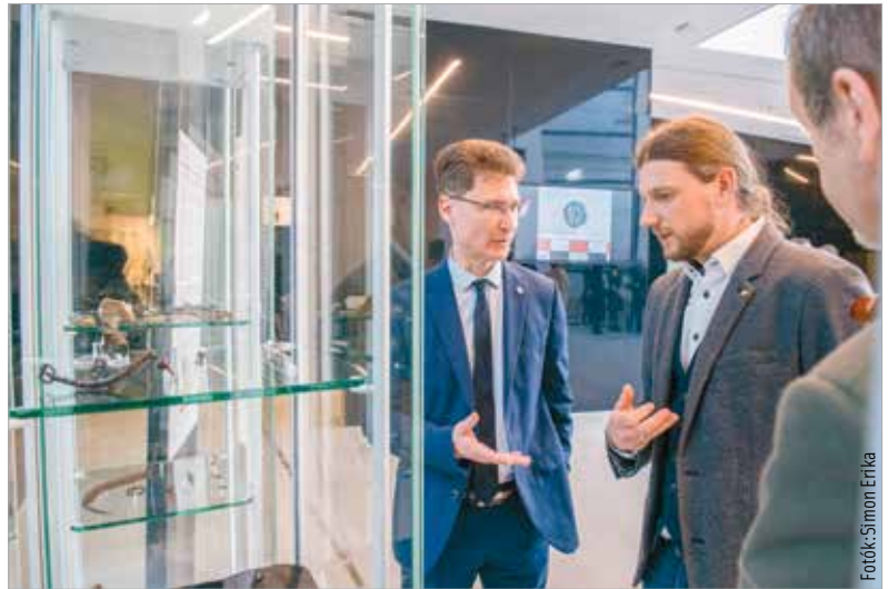
Különleges kincslelet a tatárjárás utáni időszakból