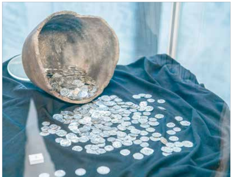
Közel nyolcszáz ezüstméret és más értékes tárgyak kerültek elő Kincsesbányán