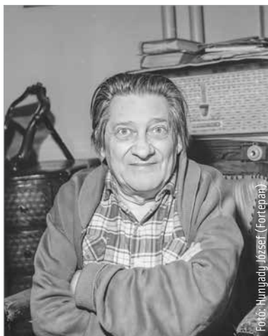
1964-ben budapesti otthonában készült ez a felvétel Kodolányi Jánosról, aki sihederkorát Fehérváron töltötte

Kodolányi aktív életet élt a fehérvári közönségben, hiszen 1917-ben már irodalmi lapot szerkesztett Diák-toll címen. A Tanácsköztársaságként emlegetett vörös diktatúra eltörölte Kodolányiékat generációjának érettségijét, ezért csak egy évvel később tudott levizsgázni. A