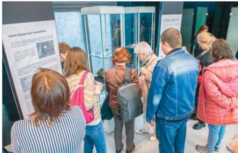
Rengetegen érdeklődtek a szerdán megnyílt kiállítás iránt, mely egy hónapon keresztül ingyenesen látogatható a Rendházépületben