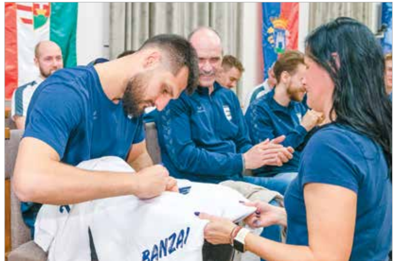
Az aranyérem a játékosok autogramjainak is felvitte az értékét