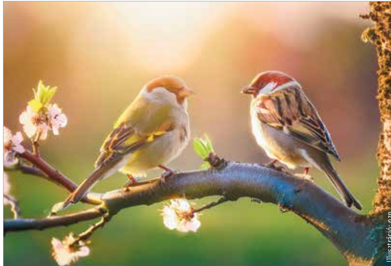
A rügyek már megjelentek, sőt a mandula is virágzásnak indult, így aztán kiosztotta Szent József a sípót a madaraknak

Azt hinnénk, hogy e három név, Sándor, József és Benedek ősidők-től összekapcsolódik a nép száján, és hagyományát a zsákkal együtt több száz éve hordozza. Pedig nem! Legalábbis Fejér vármegyé-