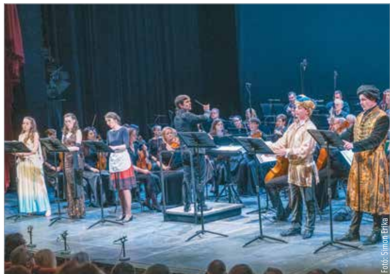
A produkció hangversenyszerű formában mutatta be a darabot neves énekművészek, valamint a Vox Mirabilis Kamarakórus közreműködésével