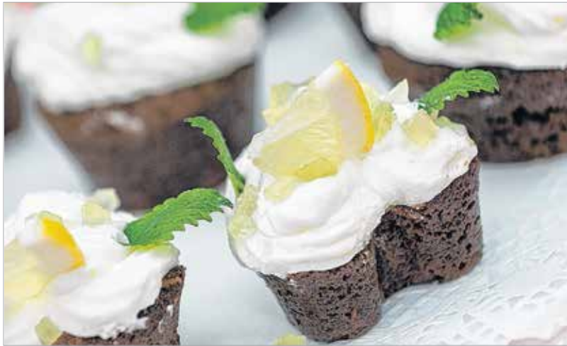
A citromos-mentás muffin az egyik legszebben komponált sütemény volt