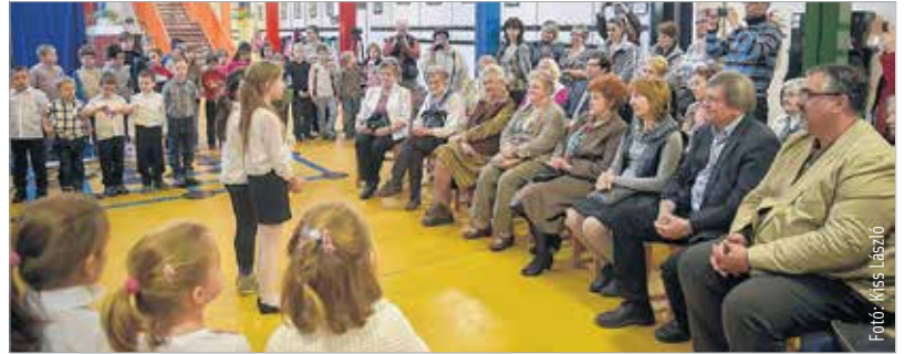
Nyugdíjas pedagógusok karácsonya a Bory Jenő Általános Iskolában – a tanítókat, tanárokat a Sziget utcai oviskó és a házigazda iskola tanulói köszöntötték másorral