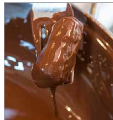
A csokoládéval gyorsan kell dolgozni, nehogy idő előtt megkőssön

minimum hatvan százalékos étcsokit vagy csokoládépasztillát érdemes használni, hogy a végeredmény olyan legyen, amit elképzeltünk. A csokit darabokra törjük. A felét vízgőz felett egy fémtálban felmelegítjük. Levesszük a tűzről, majd hozzákeverjük a maradék csokit és az egy evőkanálny kókuszszírt. (Ha van ételhőmérőnk, használjuk! A bevonat akkor lesz szép fényes, ha az olvadt csoki hőmérséklete 31-32 fok körül mozog.)