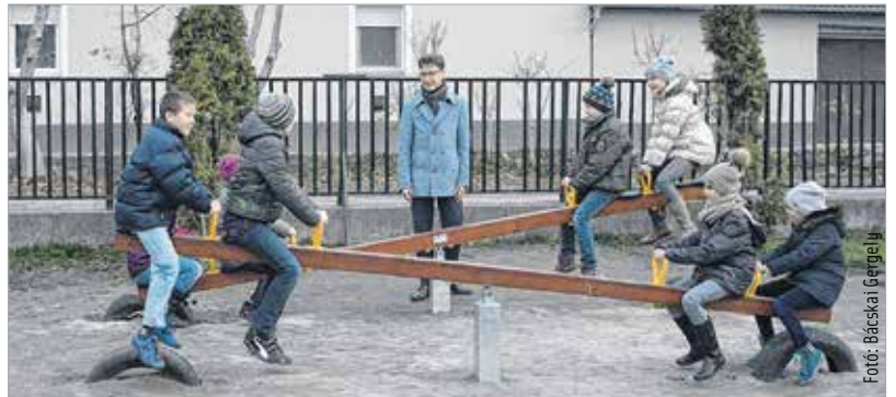
Az intézmény alapítványának és a város összefogásának köszönhetően összesen több mint két és fél millió forintos beruházás történt a Hétvezér Általános Iskolában. A szülők kezdeményezésére kilenc új játszószerkezt építettek az udvarra.