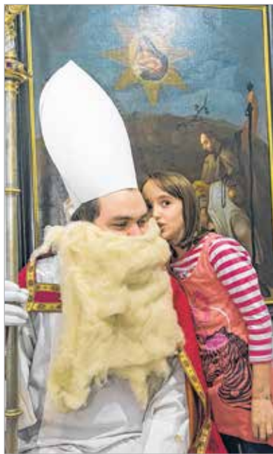
Aki jót cselekszik, bizalmat kap

Miközben a szülők nyugodtan bámészkodhatnak az adventi vásárban, a gyerekek megkelesték, mi potyogott ki a Mikulás zsákjából. Mindez az Egyházmegyei Múzeumban történt, szombaton délután.