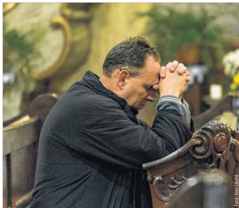
Az Irgalmasság szent éve 2015. december 8-án, a szeplőtelen fogantatás ünnepén kezdődött, és 2016. november 20-án, Krisztus király ünnepén zárul

Ferenc pápa, aki megválasztása óta azt hirdeti, hogy az egyház