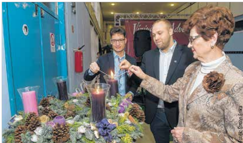
Meggyulladt a második gyertya is

teni a lokálpatrióta szemléletet az itt élő családok körében: „Azt szeretném, hogy Vízivárossal derüljön ki, hogy ez egy történelmi városrész! Szeretném, hogy akik most óvodás, kisiskolás korban először vesznek részt ezen az eseményen, továbbvigyék a hagyományt, és tizenöt-húsz év múlva büszkén mondhassák gyermekeiknek: mi már kezdettől fogva itt voltunk!” Ez a nap azért is volt különleges a vízivárosi gyermekek számára, mert megérkezett a várva várt Mikulás is, és zsákjában volt minden jó, piros alma, gyöngyör.