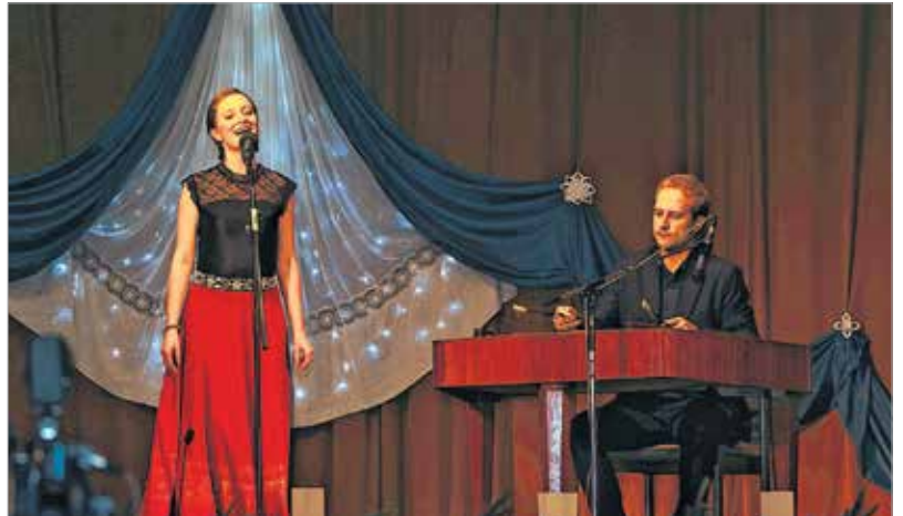
Az énekesző és a cimbalom hangja ma is összetartozik

kozott a jótékonyági est támogatói közé. Mint mondja, a dal az egyik leghitelesebb közösségformáló erő: „Mindig örömmel segítetek, ha hívó szavakat hallok. A dalok szárnyán egy kis lelki nyugalmat hozok az embereknek: örömet, vigaszt, reménységet, boldogságot. Több száz éves dalaink annyira mélyről szólnak, hogy ezek ma is megérintik az emberi lelkeket, az ünnepi dalaink pedig egészen másként, sokkal fényesebben szólnak, mert bennük a föld és az ég mindig