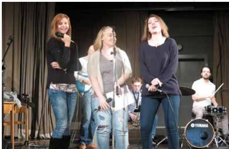
A múlt héten a zenekaros próbák elkezdődtek

DÖNTŐ www.fehervarhangja.hu Vörösmarty Színház DECEMBER 11. 18.00