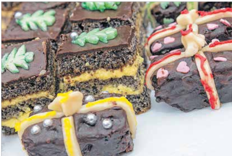
A karácsonyi csomagok megidéztek az ünnepet