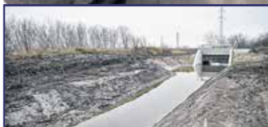
Nyárra kész az elkerülő