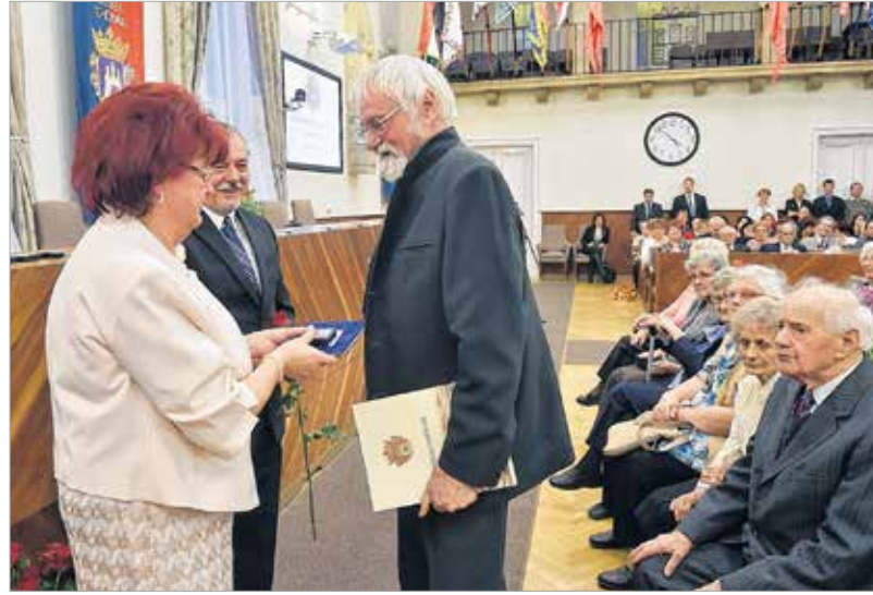
Hatvan esztendő a katedrán

ami mindig vonzott. A történelem dióhéjban című kiállításon a vérszerződéstől napjainkig, a csodaszarvastól az unokáimig minden olyan történelmi pillanatot ábrázoltam, ami egy magyar ember számára