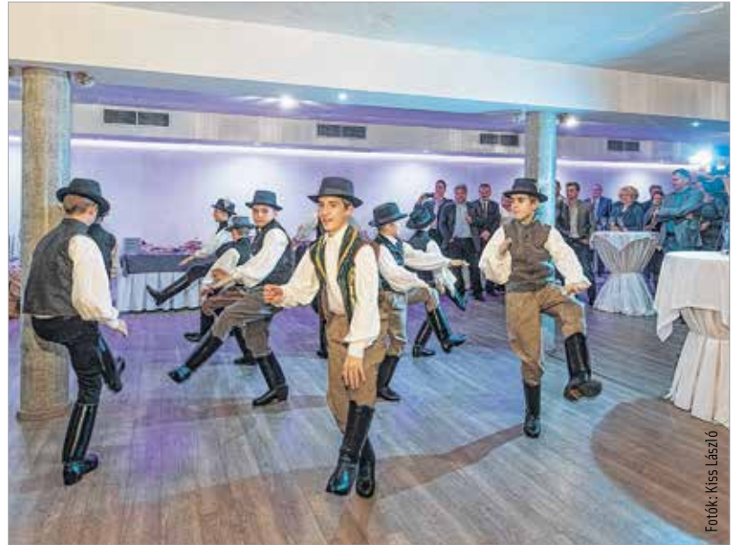
A Fehérvár Média centrum partnertalálkozóján a Pulutya csoport bizonyította, megérdemelten kerültek be a Fölszállott a páva tehetségkutatóba