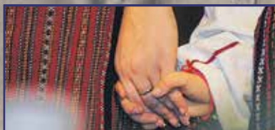
A szeretet dicsérete