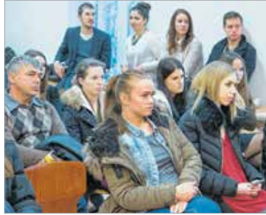
Az egyetem következő nyílt napjára januárban kerül sor

A következő tanévben a Budapesti Corvinus Egyetem hat alapképzési szakot indít Székesfehérváron. A december negyedikén tartott első nyílt napon nagy volt az érdeklődés az egyetem Budai úti campusában, ahol a leendő hallgatók kaptak tájékoztatást az oktatási intézmény és az önkormányzat vezetőitől. A szakismertető és egyetemi villámelőadások mellett egy újabb duális együttműködési megállapodás is aláírásra került, ezúttal az Alcoa-Köfém Kft-vel.