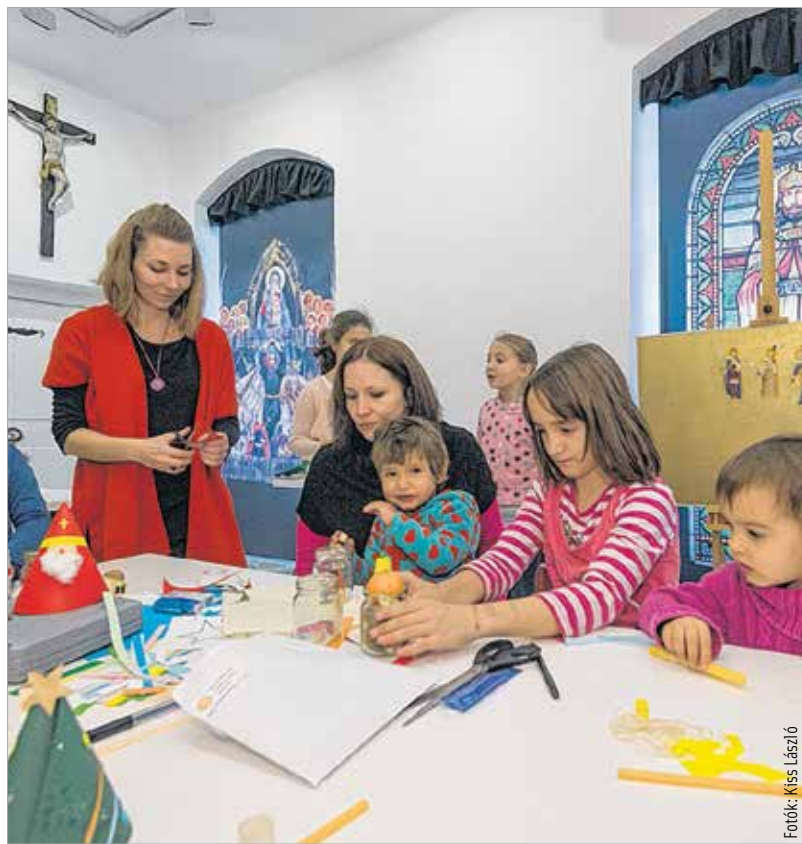
A háromszög alap tökéletes: lehet belőle fenyőfát, de akár Mikulást is formálni

Nagyobb volt a Mikulás zsákja, mint arra számítani lehetett – szimbolikus értelemben mindenképpen. Hiszen amellet, hogy a gyerekek csokikat és más apróságokat találtak a múzeum folyosóin, karácsonyi díszeket készítettek és közösen énekelve várták Szent Miklóst. S mivel a Mikulás szereti a tiszta énekhangot, meg is jelent, éppen úgy, ahogy a régi ábrázolásokon láthatjuk: püspöki süvegben, pásztorbottal. Az eredetétől csak annyiban különbözött, hogy a szakálla báránybórból készült. Ez azonban nem ingatta meg a gyerekek bizalmát: megbeszéltek vele néhány fontos dolgot, volt, aki aki még titkot is cserélt a Mikulással. Az adventi időszakban a múzeum a felnőttekre is gondolt: külön karácsonyi termet rendeztek be, ahol olyan műtárgyak, festmények kaptak helyet, amelyek a karácsony üzenetét, szimbolikáját hordozzák, Jézus születését ábrázolják. Aki pedig maga is szeretne hozzájárulni a karácsony üzenetéhez, megteheti: nem kell mást csinálnia, mint az egyházmegye weboldalán rögzíteni személyes üzenetét, amit december 20-án 18 óra és 22 óra között fényel vetítenek ki a Püspöki palota homlokzatán.