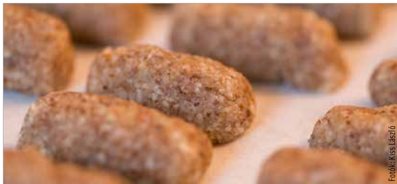
A házi marcipánt keserű mandulával és gyömbérrel is lehet ízesíteni

A pihenő után sodrófával kinyújtjuk, majd késsel körülbelül két centi széles és négy centi hosszú darabokat vágunk belőle. A csíkokat a két kezünk között megsodorjuk, a végeiket kicsit megnyomkodjuk, és egy sütőpapírral bélelt tálca alá tesszük. Ezután a munka kényesebb részéhez követez: a bevonat. A csokoládéhoz