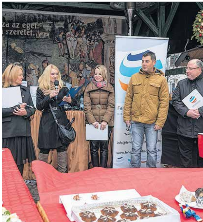
A zsűri az összes sütit lelkesen végigkóstolta

A versenyre nevezett recepteket a Fehérvár magazin december 17-i karácsonyi süteményrecept-melékletében bárki elolvashatja.