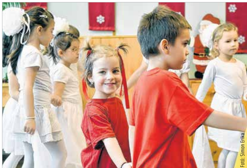
Hópihe és tűztánc – a nagycsoportosok műsorral kedveskedtek a vendégeknek a jubileum alkalmából