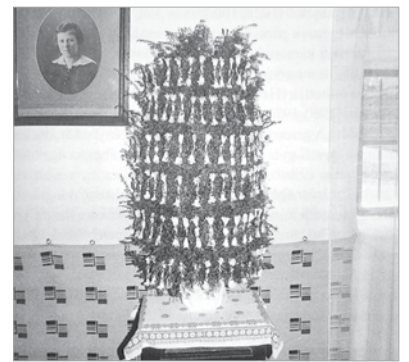
Karácsonyfa borókaágból kötözve

a legszegényebbeknek csak „üres karácsonyfa”, cserépbbe állított fenyőág jutott. Székesfehérváron a huszadik század első éveitől már nagy keletje volt a fenyőfáknak, amelyeket a piacon, előbb a Városház téren, majd a két világháború között a Ponty vendéglő előtt, a Mária-képnél (ma Piac tér) árusították. Lukács László elmesélte, hogy Fejér megyében a karácsonyfa első megjelenési formája a mestergerendára csúcsánál fogva felakasztott kis méretű fa volt. A Vértesben és a Bakonyban jellemző volt, hogy borókafenyőt vágtak ki, és azt díszítették fel. Felsővárosi parasztpolgárságánál az 1930-as években a karácsonyfa még a szoba gerendáján lógott, és ezüstpapírba csomagolt dió, házi készítésű szaloncukor került az ágakra. A Szép karácsony szép zöld fája című könyvet a Szent István Király Múzeum Fő utcai épületében, a Szent István Király Múzeum Országzászló téri épületében, a Csók István Képtárban és az Új Magyar Képtárban is megtalálhatják az érdeklődők.