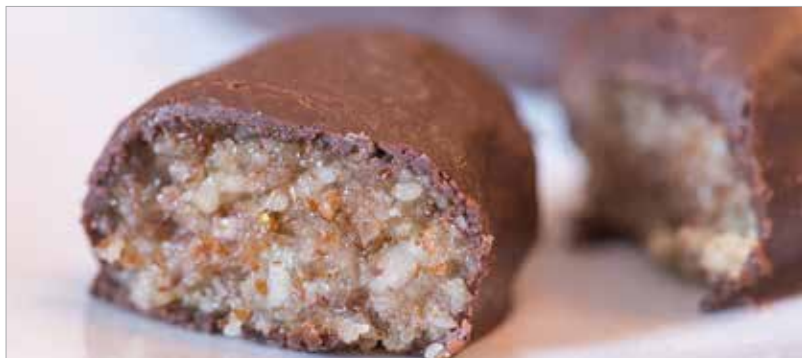
A házi szaloncukrot a család biztosan lelopkodja a fáról

A mandulát egy húsklopfóval átdaraboljuk, vagy ha van kávédarálónk, akkor átdaráljuk. A nyírfacukor felét összekeverjük a mandula