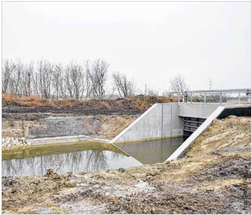
A tervek szerint halad minden a nyugati elkerülő építésénél. A közel tizenötmilliárd forintos beruházás keretében zsilip épült a Gaja és az Aszalvölgyi vízfolyás találkozásához, mely megoldást jelenthet a maroshegyi belvízproblémákra.

A beruházás keretében a Gaja-patak és az Aszalvölgyi vízfolyás találkozásánál egy nyolctonnás kombinált torkolati vízbeeresztő is épült, mely megoldást jelenthet a Székely utcai zártkertek belvízproblémájára. Mint azt Brájer Éva, Maroshegy önkormányzati