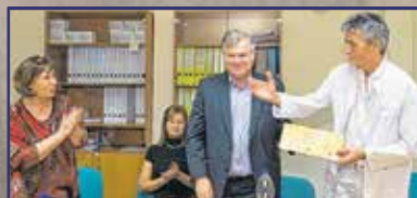
Bababarát a kórház