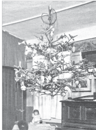
Karácsonyfa a plafonról lógva

„Azt mondják, az a boldog ember, aki a hobbijával foglalkozhat nemcsak a szabad-